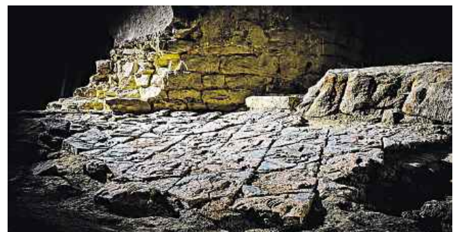
Fragment unikátní románské keramické dlažby z 11. století

Pozitivní zprávy zasílejte na adresu: www.pozitivnizpravy@lidovky.cz